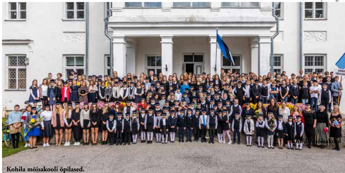
Kohila mõisakooli õpilased.