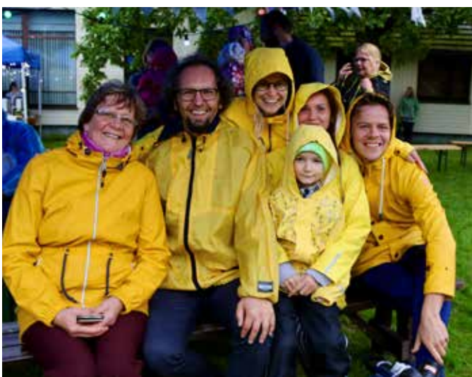
Kollane teeb rõõmu!