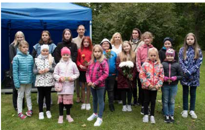
Kohila Koolituskeskuse kunstiõpetajad oma õpilastega.