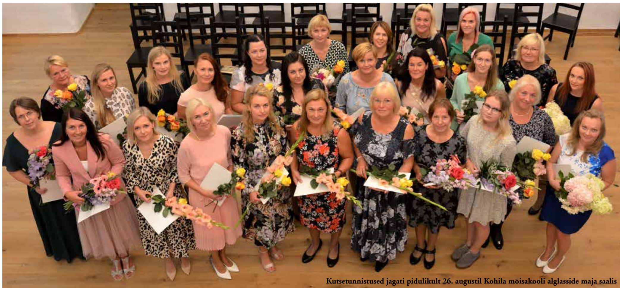
Kutsetunnistused jagati pidulikult 26. augustil Kohila mõisakooli alglasside maja saalis