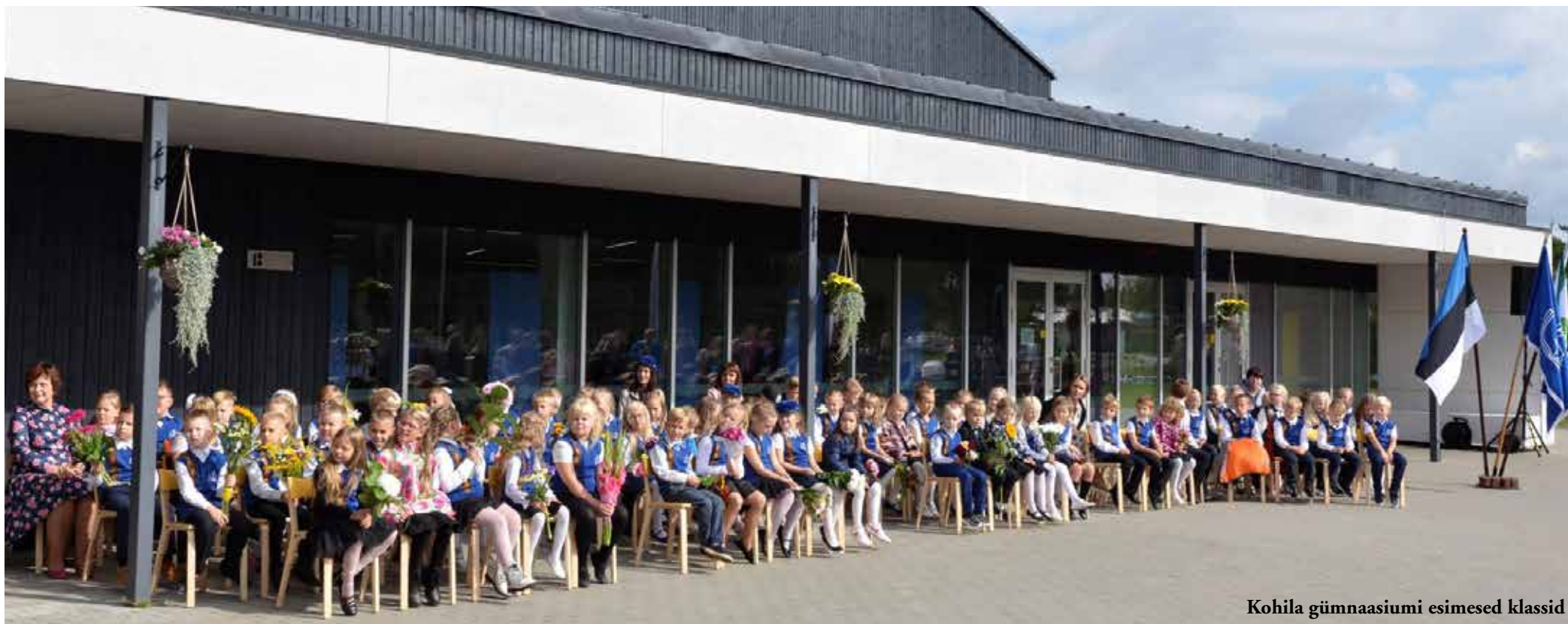
Kohila gümnaasiumi esimesed klassid