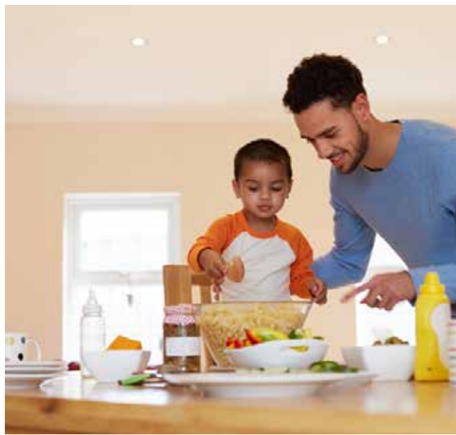
Lapse aktiivne kaasamine elulisse tegevusse võimaldab toetada loomupäraselt sõnavara arengut.

Köögis on võimalik arendada ka rühmitamisoskust: vaadake koos, mis esemed kuuluvad söögiriistade, (köögi)mööbli, (köögi)tehnikate, puuviljade, nõude jne hulka ning ka vastupidi: kuidas nimetatakse kahvleid, lusikaid, nugasid ühise nimetusega – söögiriistade. Aeg-ajalt võiks tähelepanu juhtida ka sellistele sõnadele, mis laiendavad sõnavara erinevate lõhnade, maitsete, väljanägemise ja tekstuuride osas (kõrbemise/isuäratav