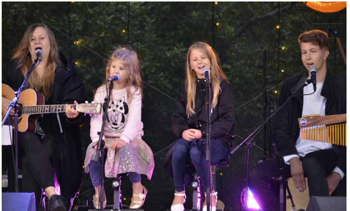
Laikrete pereansambel õunaaias piknikul.