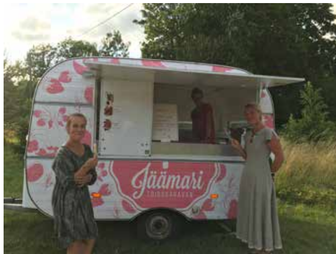
Jäämarja käsitööjääst ostes sai samuti heategevuslikku ettevõtmist toetada.

Septembri alguses andsid projekti „Avatud südamega“ korraldajad kogutud raha eest ostetud aiakiieged Katikodule ja Pahlka Camphilli küla elanikele üle. Soetatud sai toekad kolmekohalised aiakiieged, millel on mugavad istmepadjad. Loo-detavasti jagub kiikede rõõmu mitmeteks aastateks.